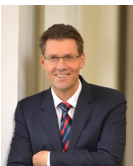
Dr. Norbert Kollmer Präsident der Landesbehörde Zentrum Bayern Familie und Soziales

Seit neuestem können auch Befundberichte und weitere Unterlagen bequem hochgeladen werden - eine Ersparnis von Zeit und Porto! www.schwerbehindertenantrag.bayern.de/onlineantrag